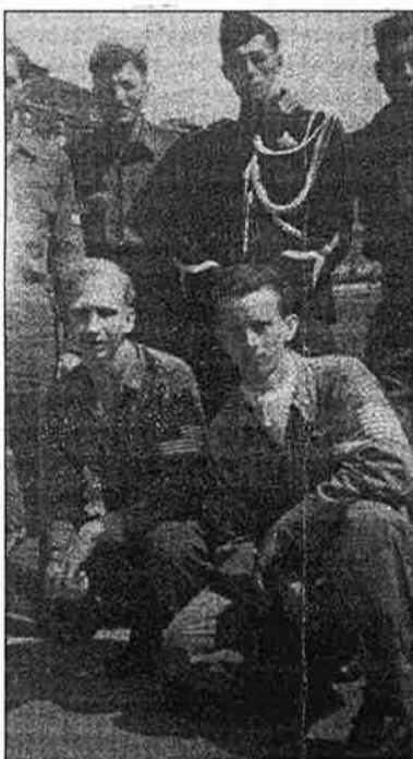
Geallieerde piloten, van wie een aantal zat ondergedoken in hoeve Landlust in Maasland.