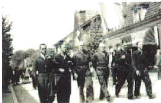
Enkele leden van de Binnenlandse Strijdkrachten in de Langestraat te 's-Gravensande, mei 1945.