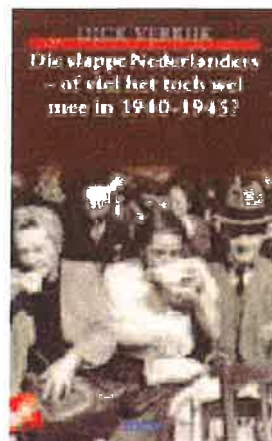
Die slappe Nederlanders – of viel het toch wel mee in 1940-1945?

Dat zijn twee uitersten en dat heeft te maken met definiëring en creatief optellen.