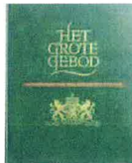
■ Het Grote Gebod: gedenkboek van het verzet in LO en LKP.

In het vierdelige werk Onderdrukking en Verzet , uitgegeven tussen 1947 en 1954 komt het verzet in al zijn facetten duidelijk naar voren. Artsen en kunstenaars komen als speciale categorieën prominent aan de orde en de verzuijing wordt mooi belicht door aan het verzet van de Rooms-katholieke Kerk, de Gereformeerde Kerken en de andere Protestante Kerken aparte hoofdstukken te wijden. In diezelfde tijd verschijnt Het Grote Gebod: gedenkboek van het verzet in LO en LKP (1951). Een belangrijk doel van deze tweedelige uitgave was het herdenken van de eigen gevallen verzetsstrijders en van hen zijn zoveel mogelijk gegevens bijeen gebracht. Van de nog levende verzetsmensen worden alleen de in de oorlog gebruikte schuilnamen gebruikt. In Het Grote Gebod komt de humanistische en vreedzame kant van het verzet naar voren; het laten onderduiken van vervolgd. Aan de andere kant zijn ook wapens nodig om overvallen te plegen voor bijvoorbeeld voedselbonnen voor de onderduikers en dat gebeurt dan weer door leden van de Landelijke Knokploegen.